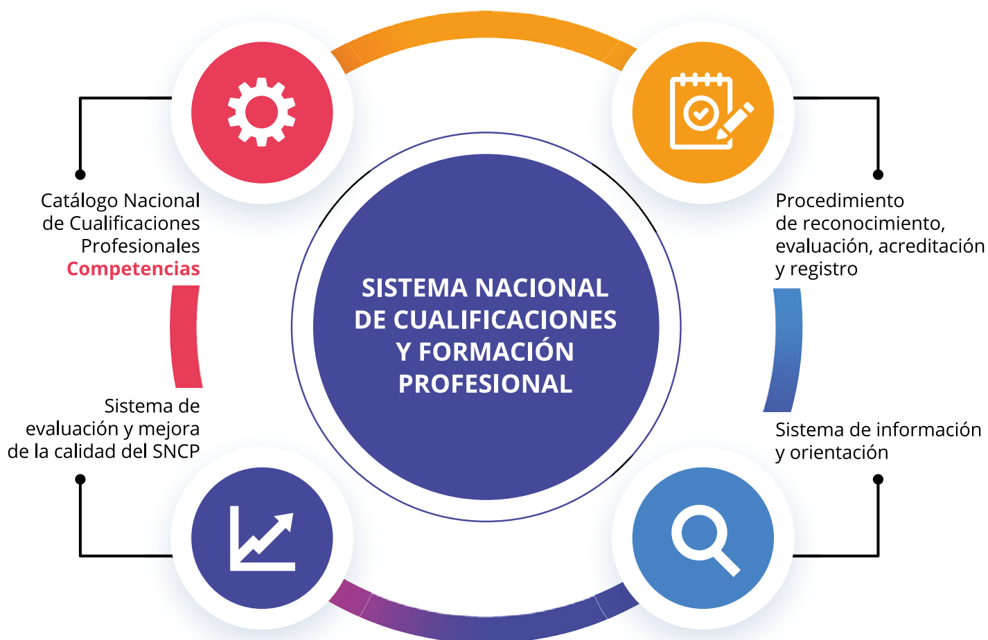
Figura 1. Instrumentos y acciones del SNCFP

La coordinación y la regulación del SNCFP corresponden a la Administración General del Estado, sin perjuicio de las competencias de las administraciones autonómicas y de la participación de los agentes sociales.