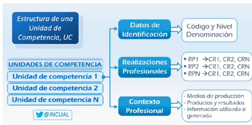
Figura 3. Estructura de una Unidad de Competencia, UC.

el componente fundamental de la cualificación. Es el elemento común mínimo que se comparte en el Sistema Integrado de FP. Su estructura general es: